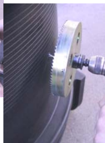
Vrtanje luknje \phi 6 mm in . . .