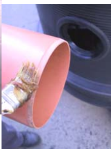
. . . PVC cevi