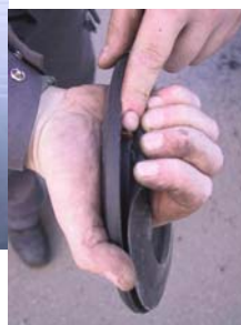
in vstopnega tesnila