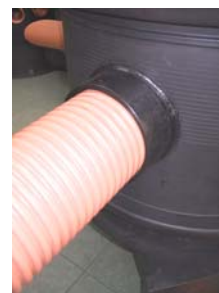
Za PVC rebrasta cev - PE prehodni kos