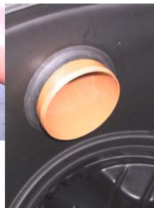
Pravilna izvedba dodatnega priključka