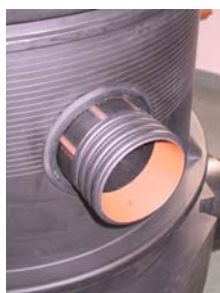
Izvedba dodatnega priključka za PE-rebrasto cev s moškim prehodnim kosom