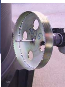
Izbira kronskega svedra in . . .