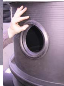
Vstavljanje vstopnega tesnila