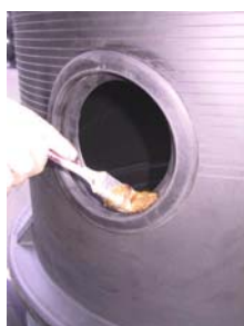
Mazanje roba vstopnega tesnila in . . .