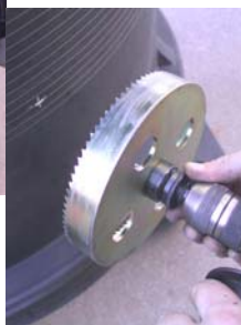
. . . pritrditev na ročni vrtalni stroj