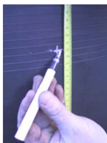
Določitev središčne višine dodatnega priključka