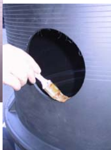
Mazanje roba . . .