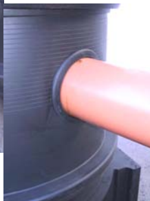
Priključitev PVC cevi