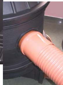
Za PVC rebrasto cev - moški prehodni kos